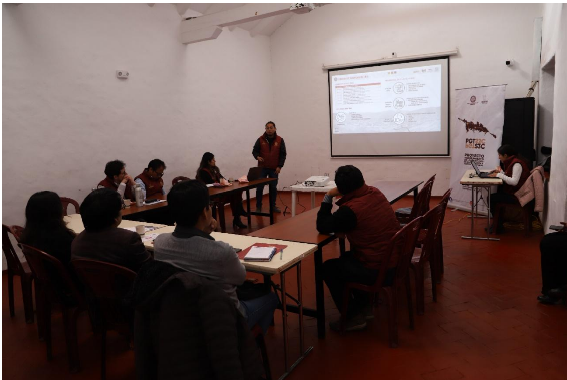
MESA TECNICA DDC

SOCIALIZACIÓN DIAGNOSTICO DIRECCIÓN DESCONCENTRADA DE CULTURA (DDC)